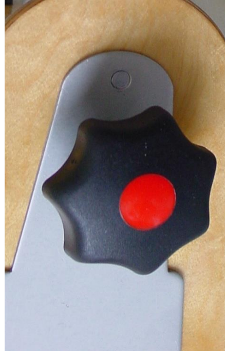
Sterngriff M 8 Ø gesamt L. ca. 60 mm