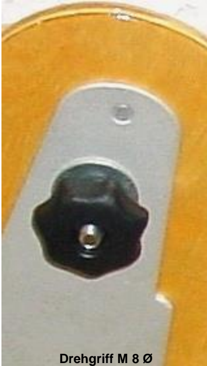
Drehgriff M 8 Ø gesamt L. ca. 38 mm

Neuheit, der Sterngriff der faltboot-Seglern in Verbindung mit dem „Schwert-Trimm“ mehr Sicherheit und Spaß am segeln erschließt.