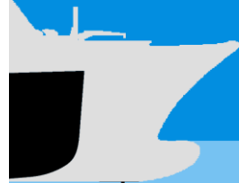
Vergleich-Rümpfe. Titanic - 1912 noch ohne, Queen Mary 2 – 2003 mit Wulstbug