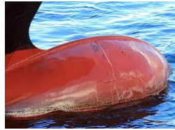
Wulstbug siehe Text oben