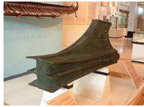
Rammsporn (unter Wasser) um 850 v. Chr. Diese Schiffe mussten damals bereits schnell sein! (Israeli National Maritime -Museum)